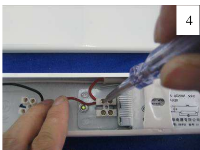
Connexion directe au 220V